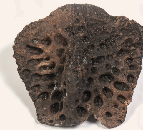
Objeto de escamas de cocodrilo